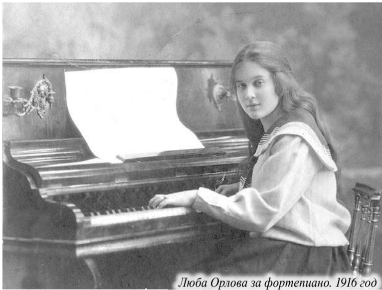
Люба Орлова за фортепиано. 1916 год