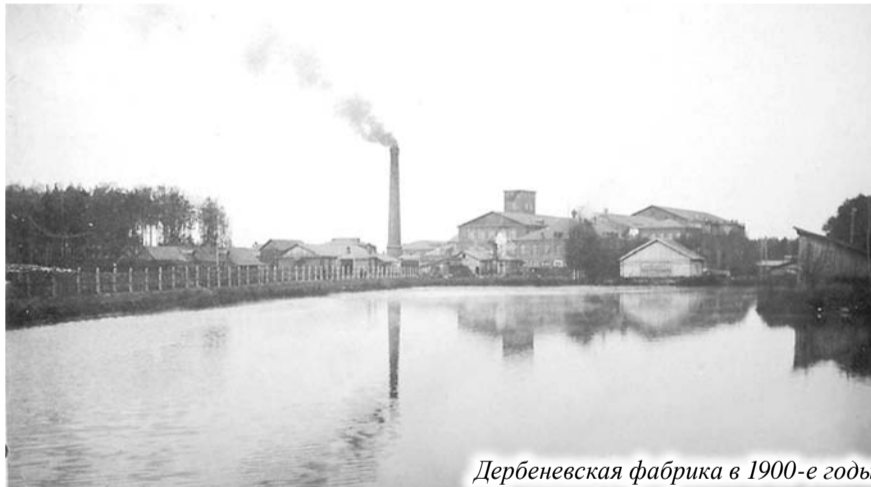
Дербеневская фабрика в 1900-е годы

В нынешнем году исполнилось 110 лет с той поры, когда в 1908 году началась электрификация ткацко-прядильной фабрики братьев Дербеневых в пустоши Камешково и поселка Авдотьино при ней - предтечи нынешнего города Камешково.