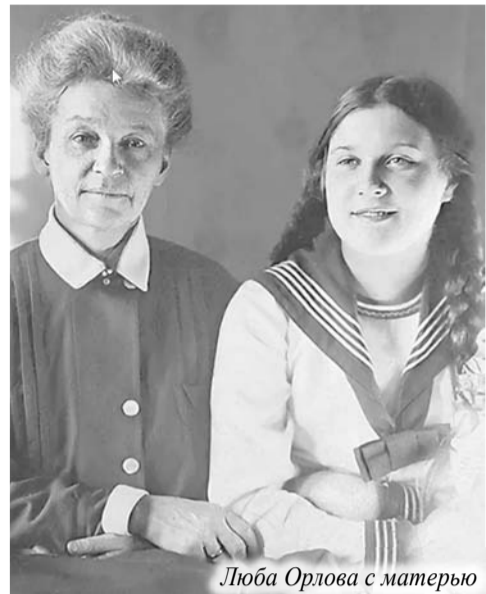
Люба Орлова с матерью