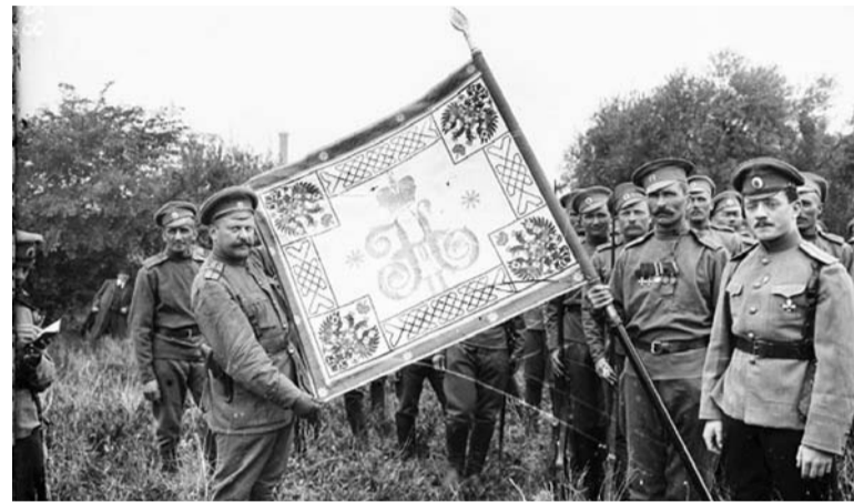
Русский экспедиционный корпус во Франции

Затем вместе с Марокканской дивизией Русский легион атакует и прорывает укрепленную линию Гинденбурга. Моральное состояние противника к этому времени было настолько подорвано, что он отводит свои войска к германской границе. Война окончена. Радости людей не было предела. В со-