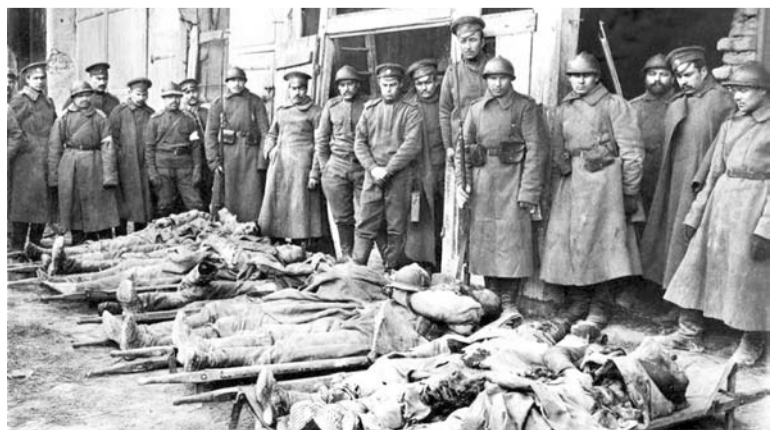
За веру, царя и Францию

2-я, 3-я, и 4-я бригады были отправлены на фронт Шампани, остальные - в распоряжение генерала Саррайля в Македонию на Салоникский фронт. И на полях Шампани, и в горах Македонии русские особые полки покрыли себя неуязвимой боевой славой. Но и жертва, принесенная на алтарь Отечества на чужбине, была велика. Могилы русских воинов разбросаны по всей Франции и по всей Македонии.