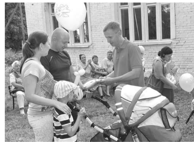
Поздравление с новорожденными