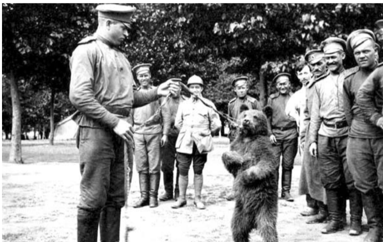
Полковой талисман - Мишка

Самое же большое военное русское кладбище, где покоится более тысячи наших братьев, находится около Мурмелона (провинция Марна, Франция).