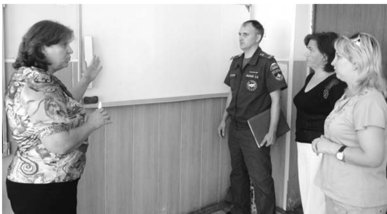
Проверка готовности в школе № 3

Все образовательные учреждения города сегодня оснащены кнопкой экстренного вызова полиции (3 школы, 4 дет-