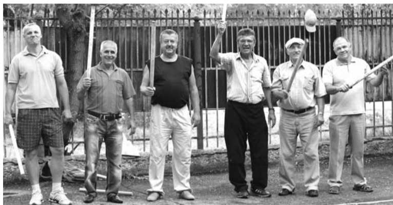
Финалисты районного турнира по «городкам»

- Для страны очень важно, чтобы население занималось спортом. Без физкультуры даже при высоком уровне жизни достичь хороших результатов в демографической сфере, увеличить продолжительность жизни граждан и повысить производительность труда невозможно. А ведь это важные экономические показатели. Кроме того, физическая активность человека - это один из определяющих показателей качества жизни. Нужно, чтобы каждый человек понимал - либо спорт и активная полноценная жизнь, либо вредные привычки, болезни и преждевременная смерть. Наша задача - сделать все для того, чтобы физкультура и спорт стали максимально доступными для людей всех возрастов. Нужно строить новые комплексы и стадионы, чтобы у молодежи была возможность заниматься различными видами спорта. Тогда каждый сможет найти себе занятие по душе. Я сам веду здоровый образ жизни, в юности занимался легкой атлетикой, сейчас играю в футбол, баскетбол, настольный теннис, люблю плавать. Все это доставляет мне огромное удовольствие. Сегодня я хочу принять участие в