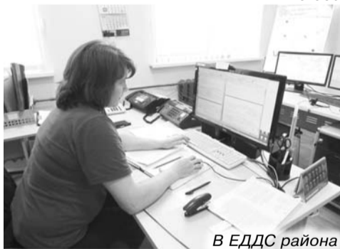
В ЕДДС района