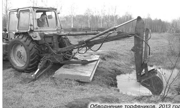
Обводнение торфяников. 2013 год

- Этот вопрос очень серьезно обсуждался на расширенном заседании комиссии по предупреждению и ликвидации чрезвычайных ситуаций, состоявшемся 13 апреля. Речь шла о том, и это звучало в том числе в выступлениях глав администраций сельских поселений, что на нашей территории много собственников и арендаторов, кото-