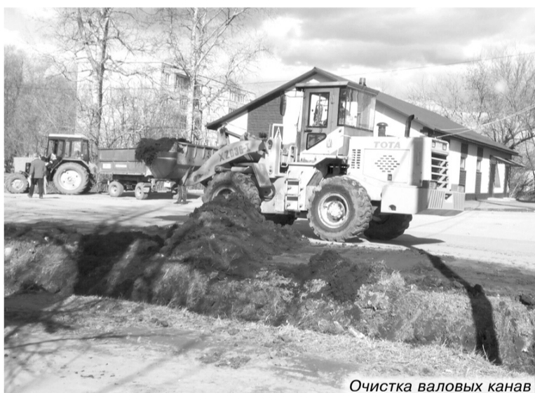
Очистка валовых канав

Уже определены и согласованы с депутатским корпусом города первоочередные задачи, которые необходимо решить в этот сезон. В рамках подготовки к празднованию Дня Победы до 5 мая будут приведены в порядок дороги по маршруту следования Бессмертного полка. Выставлены на торги работы по ремонту моста над железнодорожной линией, ведутся переговоры с несколькими подрядчиками, у которых уже сложилась хорошая репутация.