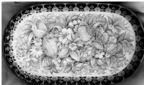
Одна из работ нашей землячки

Книга содержит содержательные очерки об истории поселка – известной с начала XVII столетия, о развивающихся в Мстере художественных промыслах (в том числе шитье и изготовлении ювелирных изделий), а также биографические справки о 35 наиболее известных и заслуженных художниках из Мстеры, как уже ушедших, так и ныне здравствующих, творивших прежде и работающих ныне в технике мстерской лаковой миниатюры. На высоком полиграфическом уровне воспроизведены 125 работ этих мастеров, созданные с 1928 по 2016 гг. Самой первой по времени написания, из числа помещенных в альбом, является ставшая уже хрестоматийной роспись шкатулки Н.