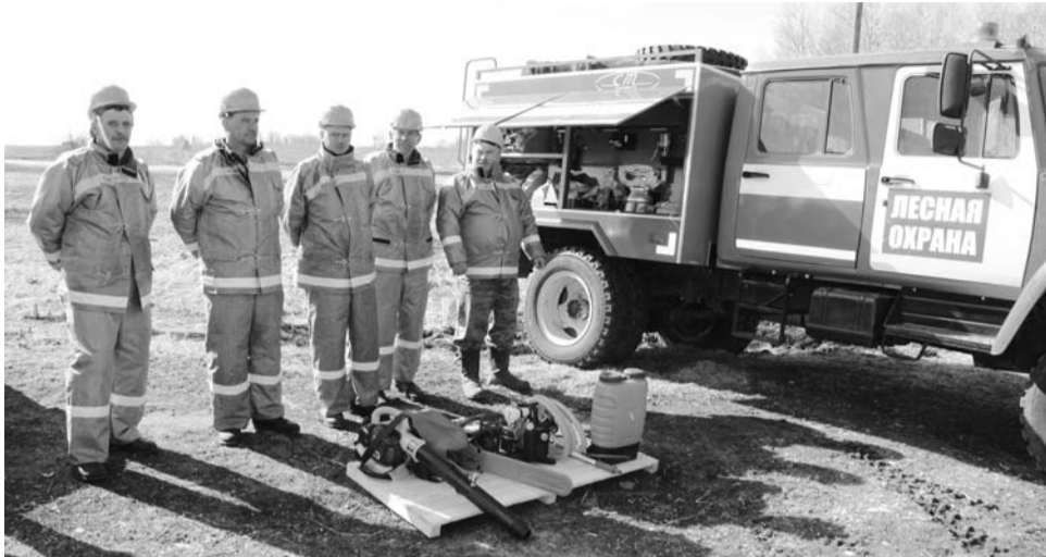
Пожарные в «полной боевой»

А вначале в Доме культуры состоялось расширенное совещание администрации Камешковского района с членами КЧС и ОПБ при участии руководителя и членов рабочей группы по проверке ПСЧС области к пожароопасному сезону нынешнего года. Перед собравшимися выступили главы МО и рассказали о том, какими силами и средствами пожаротушения располагает каждый муниципалитет и что планируется сделать в сфере профилактики лесных пожаров в этом году. Заместитель начальника управления гражданской