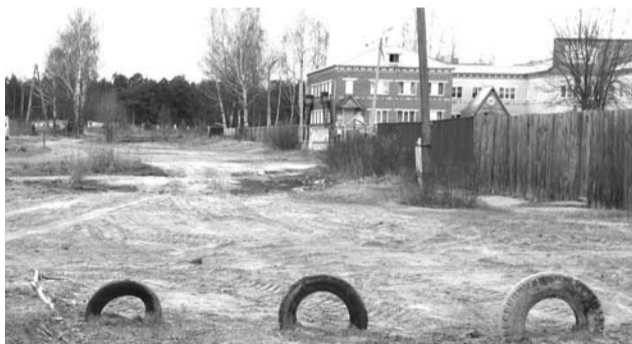
От места аварии не осталось и следа

Но проблема, по словам А.Е. Малова, осталась: здесь не обойтись без капитального ремонта; кроме того, участок ул. Совхозной с частным сектором по-прежнему живет без воды. Выставлен на торги контракт на прове-