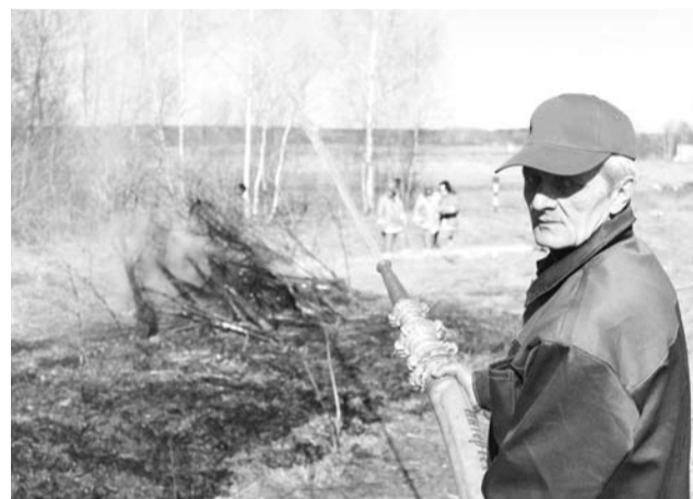
Главное - сильный напор воды

Кроме того, заключены договоры на оказание услуг в области защиты земель госзапаса на поставку инженерной техники и материальных ресурсов с Камешковским