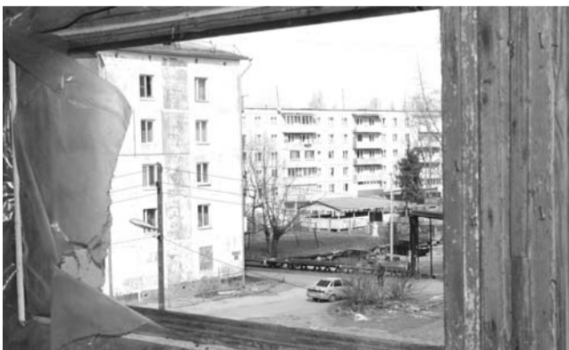
Бывшее общежитие: вид из окна с выбитыми стеклами

Начало приема в 10.00, каб. № 6, в помещении администрации г. Камешково (в управлении ЖКХ). Возможны обращения по тел.: 2-30-99.