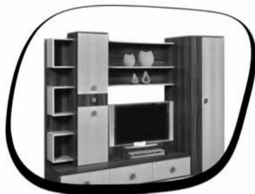
Стенка «ВЕРОНА» 2400X1850X380 мм 13.900 9.990