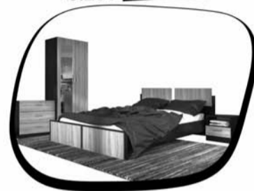
Спальный гарнитур «ФЛЕР» 21.900 14.990