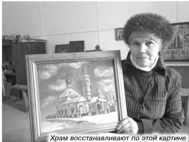
Храм восстанавливают по этой картине