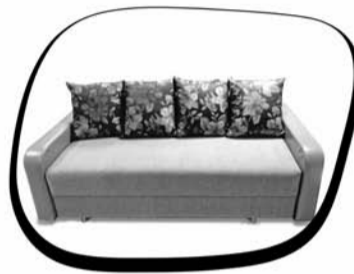
Диван-кровать (еврокнижка) «ФАНТАЗИЯ3-6Н» 2200X1050 мм спальное место 1850X1560мм 21.400 14.990