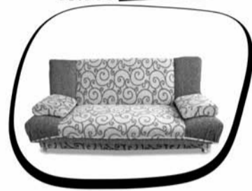
Диван-кровать (книжка) «ЛОДОЧКА-Н» 1900X850 мм спальное место 1900X1200мм 15.000 10.500