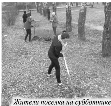
Жители поселка на субботнике