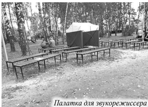
Палатка для звукорежиссера