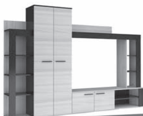
СТЕНКА ОСЛО 2310X1835X365 мм 8.800

0% ПЕРЕПЛАТЫ ЗАЧЕМ ЖДАТЬ И КОПИТЬ? * РАССРОЧКА НА МЕБЕЛЬ