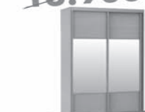
ШКАФ-КУПЕ ХИТ 1200X2200X600 мм 9.490