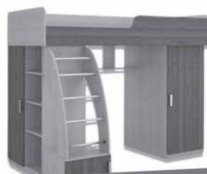
КРОВАТЬ МИКА 2042X1800X1200 мм 14.990