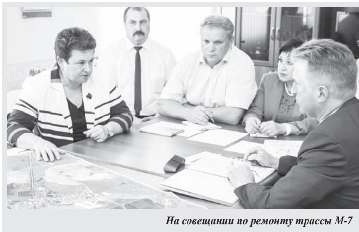
На совещании по ремонту трассы М-7

Сейчас в районе Лакинска генеральный подрядчик – ООО «ДСК» – ведет второй этап работ на участке протяженностью 4,5 км. Этот участок затрагивает и центр города. Здесь предусмотрено устройство трех транспортных развязок в одном уровне: на 152-м, 153-м и 155-м километрах. Участок оборудуют шумозащитными экранами, водопропускными трубами, тротуарами, автобусными