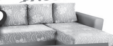
ДИВАН-КРОВАТЬ ФАНТАЗИЯ УГОЛ с функциональной подушкой с функцией хранения вещей 20.990