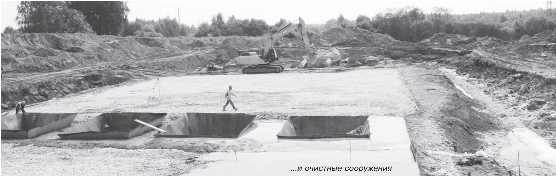
...и очистные сооружения