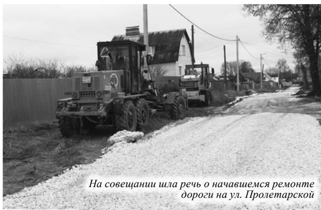
На совещании шла речь о начинающемся ремонте дороги на ул. Пролетарской