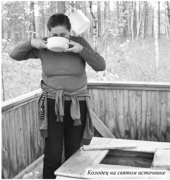
Колодец на святом источнике