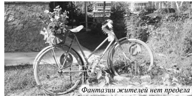
Фантазии жителей нет предела