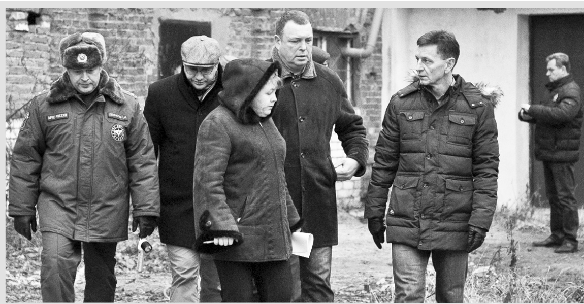
Во время посещения собинских «казарм»