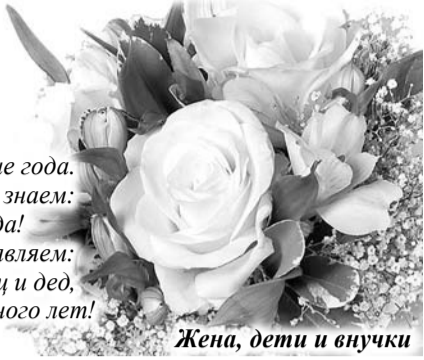
Жена, дети и внушки

из пос. им. М. Горького. Мы тебе желаем: Здоровья, бодрости на долгие года. Будь таким, каким тебя мы знаем: Добрый и отзывчивым всегда! И со всею смелостью мы заявляем: Ты лучший в мире муж, отец и дед, Живи еще на свете много-много лет!