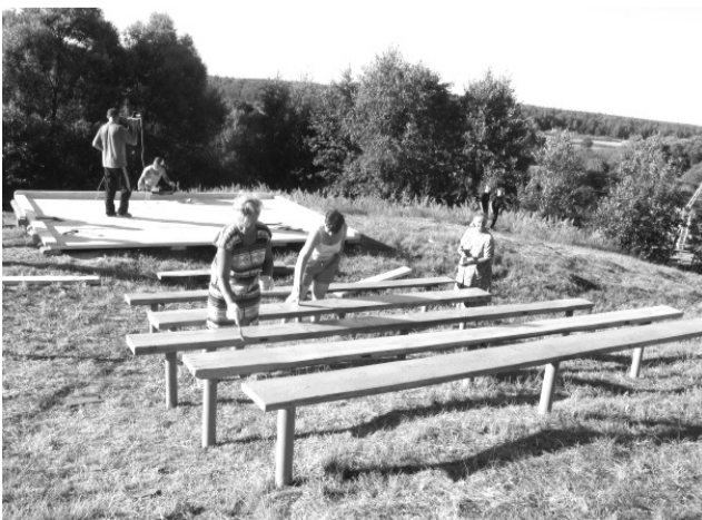
«Солнечная поляночка» обустроена в прошлом году

«Солнечная поляночка» по определению не должна без веселья простаивать. И потому, внимание: в ближайшую субботу, 12 июля, в Усоллье пройдет престольный праздник Казанской Иконы Божьей Матери и День села. Приезжайте, будет не скучно!