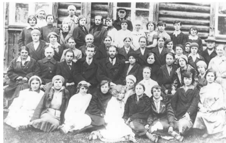
Начало 30-х годов