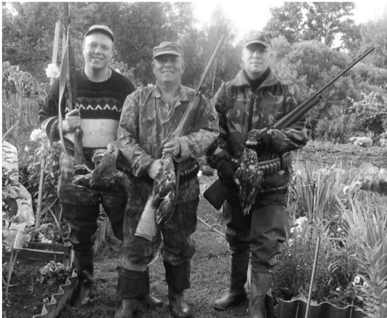
И было у знатного охотника два сына...

В детстве он часто приезжал из города к родственникам и вместе с о старшими «дядьями» нередко ходил (плавал)