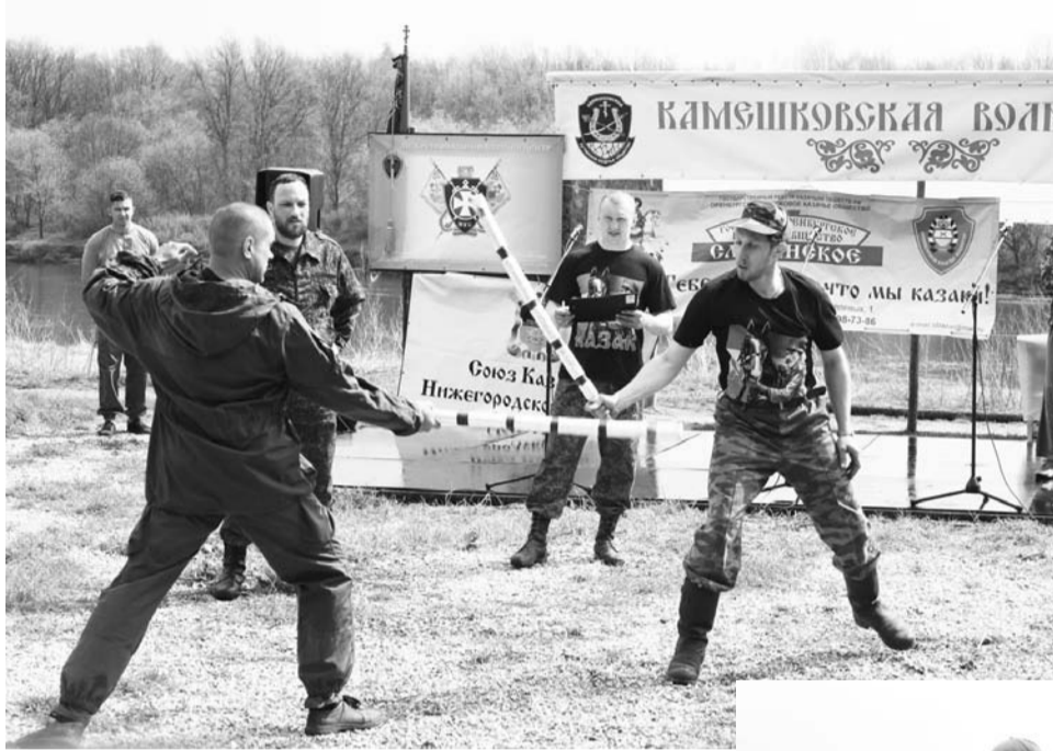
Казак молодой, а сноровка боевая

- Народу с каждым разом приходило все больше; были не только наши друзья и близкие, но и совершенно незнакомые люди. Мы поняли, что это интересно и казачьи тра-