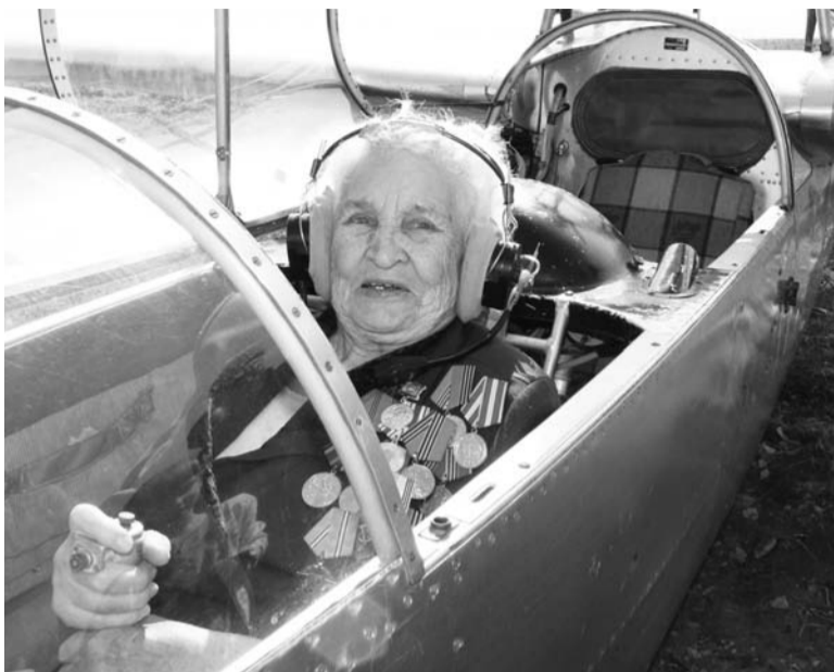
В бой идут одни «старики»!

- Я летала на У-2, тогда все учились летать на нем. Он легок в управлении, площадка для взлета ему нужна небольшая. Попала в авиацию по специальному набору в 1938 году. В то время актуальным был девиз – «Молодежь - на самолеты!», и все мечтали о небе. Училась летать в г. Семипала-