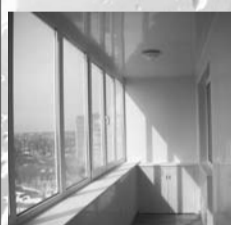
Лоджии с полной внутренней отделкой