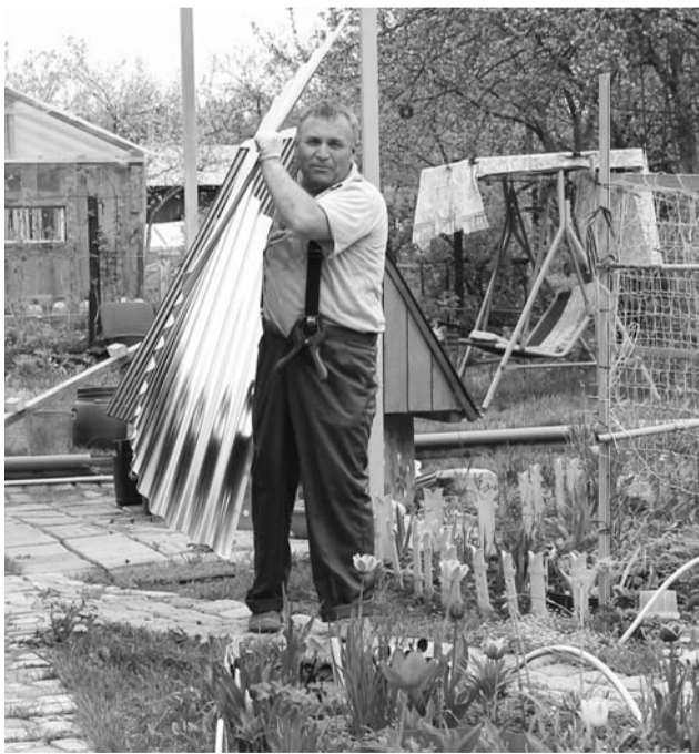
Своя ноша не тянет...

Но оставив эстетические предпочтения в стороне... Кто состоял в садовых кооперативах, тот знает – у садоводов каждый сезон горы хлопот. Так и здесь. Главная проблема – подъездные пути. Подсчитано: с 2000 по 2013 год на строительство дороги, ведущей в д. Грезино и к дачным участкам, садоводы потратили 2,5 млн рублей. И каждый год в дорогу вкладываются все новые средства. Но всему же есть пределы... Недавно близ этой самой дороги энергетики проводили ЛЭП-500, и мощные лесовозы, курсирующие по трассе, нанесли