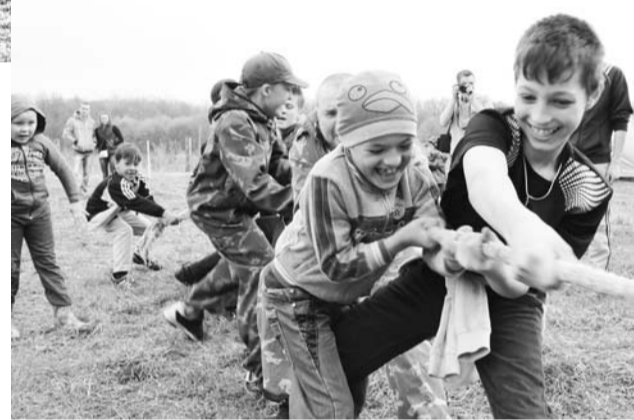
Дети на фестивале не скушали

Вот лишь несколько заповедей казачества, которые лучше всего отража-