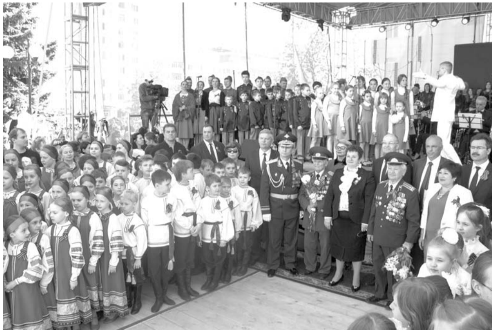
Гимн Победе в исполнении региональной хоровой ассамблеи