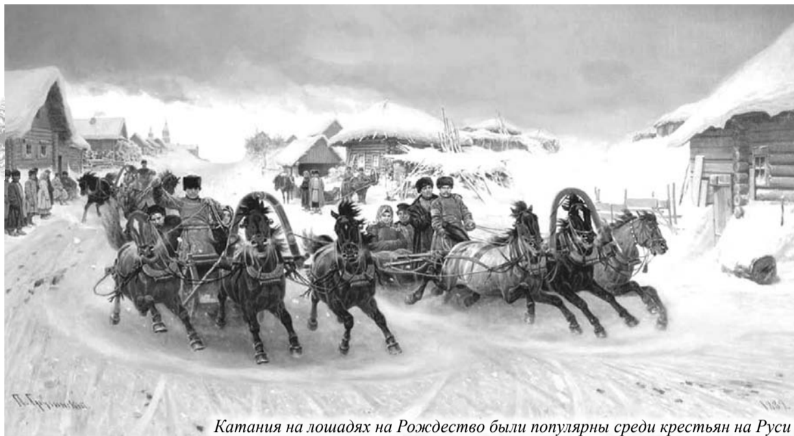
Катания на лошадях на Рождество были популярны среди крестьян на Руси

Впрочем, празднование «первого дня во году», как тогда именовались новогодние торжества, в основном, происходило лишь в Москве, где в Кремле на Соборной площади совершался крестный ход с участием царя и патриарха, причем все придворные обязаны были участвовать в этом действе исключительно в богатых кафтанах, расшитых золотом. Весь церемониал сводился к общему молебну и поздравлениям царя и патриарха. Никакого застолья при этом не устраивалось.