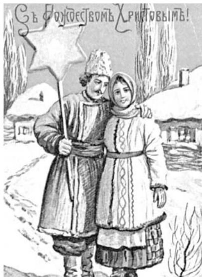
Рождественская открытка, на которой пара изображена с Вифлеемской звездой