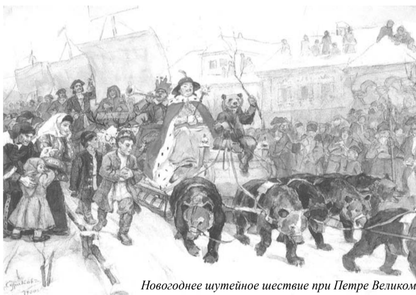
Новогоднее шутейное шествие при Петре Великом