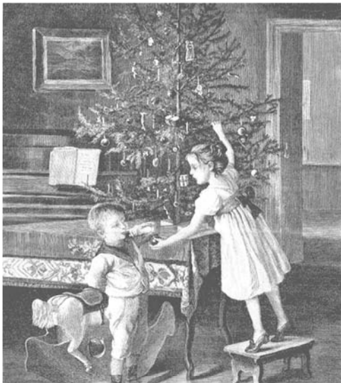
Украшение Рождественских елок в России вошло в моду лишь во второй половине XIX столетия