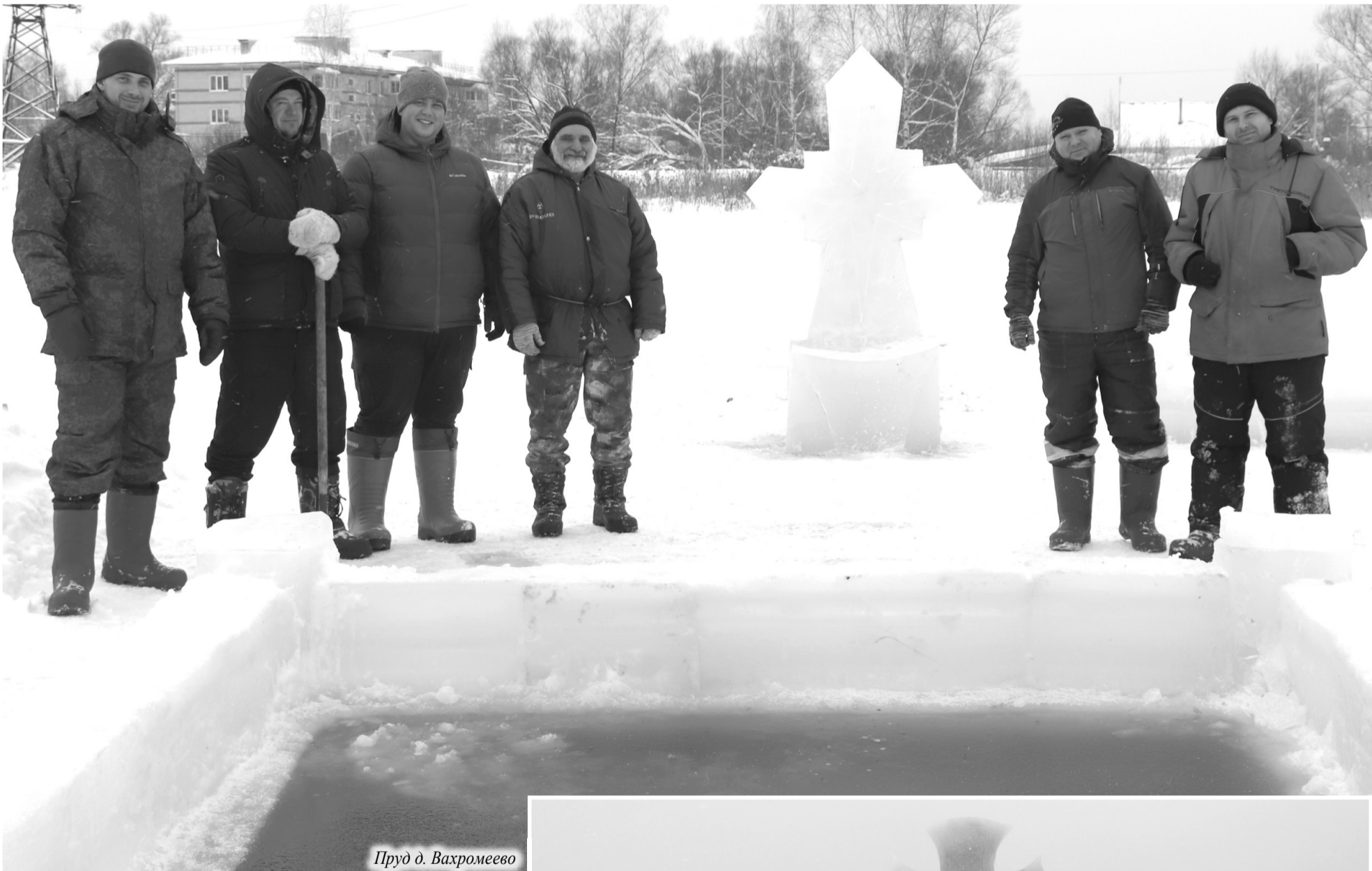
Пруд д. Вахромеево

Тема дня Сегодня, 19 января, православные отмечают Крещение Господне - один из самых значимых христианских праздников. В Камешковском районе, как и по всей стране, в этот день и в ночь с 18 на 19 января проходят богослужения и крещенские купания. Одни из самых красивых иорданей в нашем районе традиционно созданы инициативными жителями на пруду д. Вахромеево и в г. Камешково - на озере Малое Урсово.