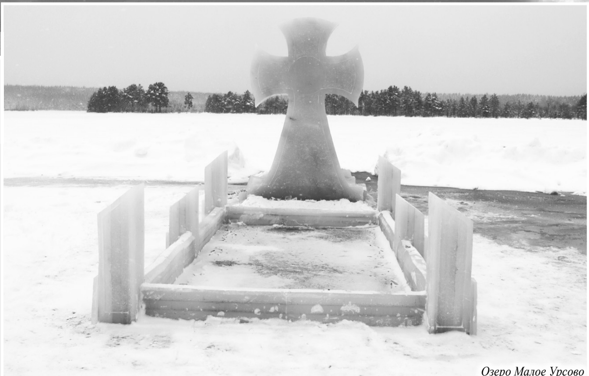
Озеро Малое Урсово