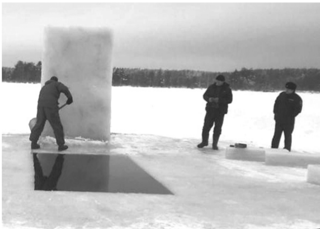
Процесс подготовки купели на озере Малое Урсово