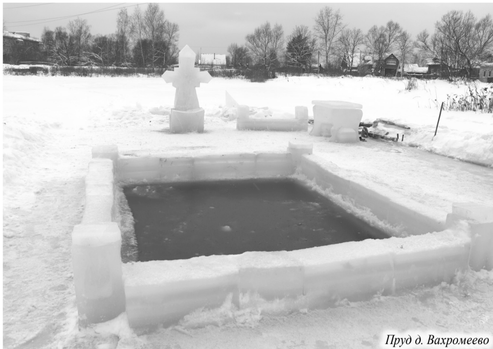
Пруд д. Вахромеево

В каждом муниципальном образовании к этому празднику готовятся особенно - кто-то участвует в обустройстве купелей, а кто-то настраивается морально и духовно на омовение в ледяной воде. В городе Камешково и трех сельских поселениях района есть официально разрешенные места для купания. В Камешковском районе их (по сравнению с другими районами) много, каждое рассчитано на определенное количество человек. Например, в городе Камешково купель по традиции вырезали на озере Малое Урсово, и рассчитана она на 150 человек. В МО Брызгаловское, как всегда, установили стационарную купель около Всехсвятской церкви в селе Эдемское - это большая емкость с водой, искупаться в которой могут за период крещенских купаний аж 280 чело-