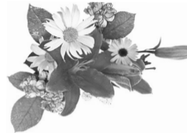
С любовью, дети и внуки

Ты отдала семье так много лет – Готовила, стирала и пекла, Дарила нам своей улыбки свет, Очаг семейный чутко берегла. Заботой на заботу отвечаешь, Мы все тебя давно боготворим; Здорова будь и счастлива, родная! От всей души тебя благодарим!