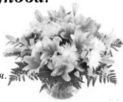
Дети и внуки

Живи, родная, до 100 лет И знай, что лучше тебя нет. Сегодня, завтра и всегда Желаем жить без старости, Работать без усталости. Здоровья – без лечения, счастья – без огорчения. Желаем благ тебе земных. Мы знаем – ты достойна их!