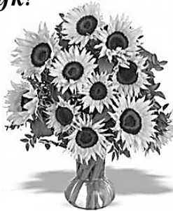
С уважением, Л. Удалова и В. Мартынов

Пятьдесят пять лет!!! Горит в глазах все тот же свет, И ты прекрасна, как всегда, Бессильны пред тобой года! Мы поздравляем с днем рожденья! Желаем счастья и везенья. Пусть близкие, всегда любя, Только радуют тебя. Пусть надежда и любовь Приходят в гости вновь и вновь. Мы восхищаемся тобой, Будь такой же молодой!