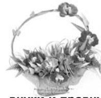
Дети, зятья, сноха, внуки и правнуки

Единственной, родной, неповторимой Мы в этот день «спасибо» говорим. За доброту и сердце золотое, Мы, мама милая, тебя благодарим. Пусть годы не старят тебя никогда, Мы, дети и внуки, все любим тебя. Желаем здоровья, желаем добра, Живи долго-долго, ты всем нам нужна!