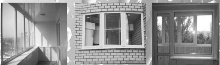
Лоджии с полной внутренней отделкой