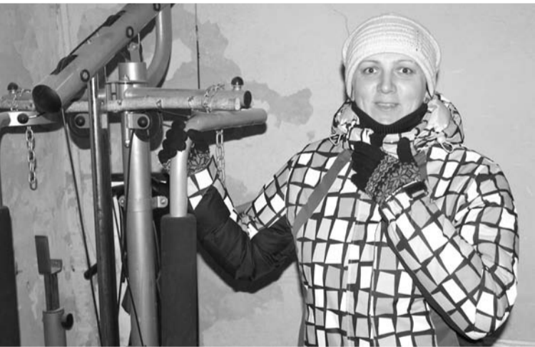
Тепло ли тебе, девица, в зрительном зале?

А. ПАРФЕНОВ. (При подготовке использованы материалы краеведческого сборника «Память сердца»)