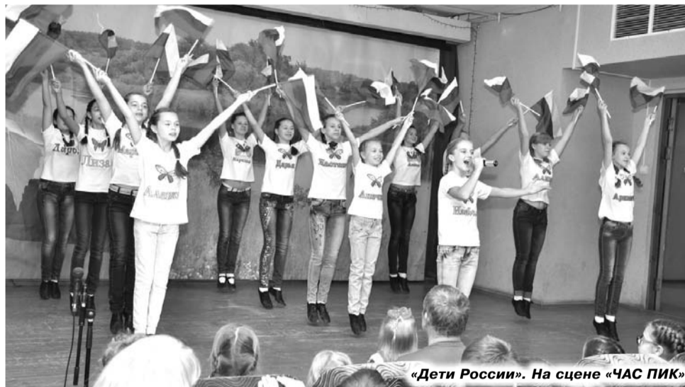
«Дети России». На сцене «ЧАС ПИК»

ПОД ТАКИМ названием 4 ноября в малом зале РДК «13 Октябрь» состоялся отчетный концерт творческих коллективов Дома культуры, посвященный Дню народного единства. Этот праздник – дань искреннего уважения к великой истории нашей страны и продолжение ее славных традиций.