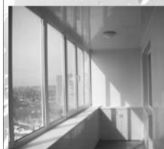
Лоджии с полной внутренней отделкой