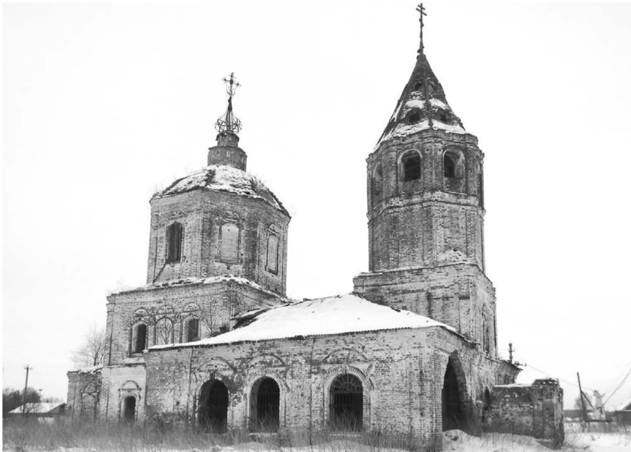
Троицкий храм недействующий, и не заметны попытки привести его в порядок