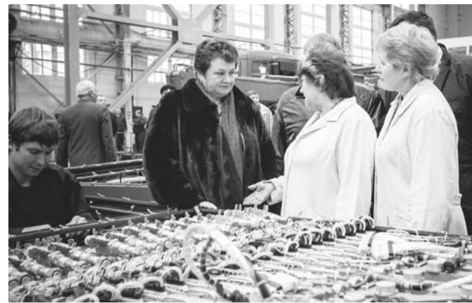
С. Орлова: «Рабочие кадры для собственных предприятий нужно готовить самим»

«Сегодня в Муроме я в очередной раз убедилась, что мы не потеряли рынки. Здесь серьёзные производства, особенно, в оборонном секторе, с применением инновационных технологий. Считаю, что за такими предприятиями будущее. Но за высокой технологичностью открывается проблема — большое количество неиспользуемых площадей. Этот вопрос мы также будем совместно решать. Считаю, что совещание было полезно для его участников. Региону нужно «стартовать», для чего потребуются объединение усилий всех сторон — предприятий, органов власти, научного сообщества, малого и среднего бизнеса. В связи с этим необходим постоянный диалог», - резюмировала итоги поездки Светлана Орлова.