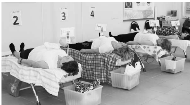
Очередной сеанс восточной терапии на ул. Школьной

Наверно, не нужно никому пояснять, что костно-мышечная система является «каркасом» человеческого тела. И главный орган его – позвоночник, который включает 24 позвонка и 31 пару нервных окончаний (корешков), которые связаны со спинным мозгом. Причина многих заболеваний кроется в состоянии позвоночного столба. Поднятие тяжестей, недостаток полезных микроэлементов в организме, преклонный возраст, неправильное питание, лишний вес, сколиоз у детей и взрослых могут стать причиной нарушений в позвоночнике. Оборудование НУГА БЕСТ служит для коррекции позвоночника и помогает устранить все эти неприятные последствия, стимулирует вос-