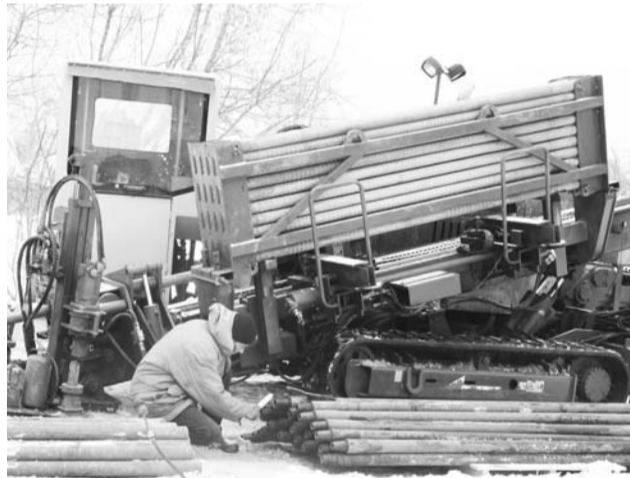
На ул. Долбилкина будут проложены новые трубы

внимание обращается на придомовые колодцы. Чтобы предотвращать негативное воздействие на работу централизованной системы водоотведения и уменьшить риски возникновения аварийных ситуаций на канализационных сетях, решено устанавливать в колодцах сетки-ловушки для крупного мусора, поэтому сейчас организация занимается их изготовлением. Напомним, что на сегодняшний день одна из основных причин возникновения большого числа аварийных ситуаций, связанных с засорами на сетях водоотведения в городе – это попадание в канализационную систему бытового мусора, сбрасываемого горожанами. Банки с испорченными законсервированными овощами и даже одеяла попадают в сеть канализации, осаждаются на дне трубопровода, тем самым затруд-