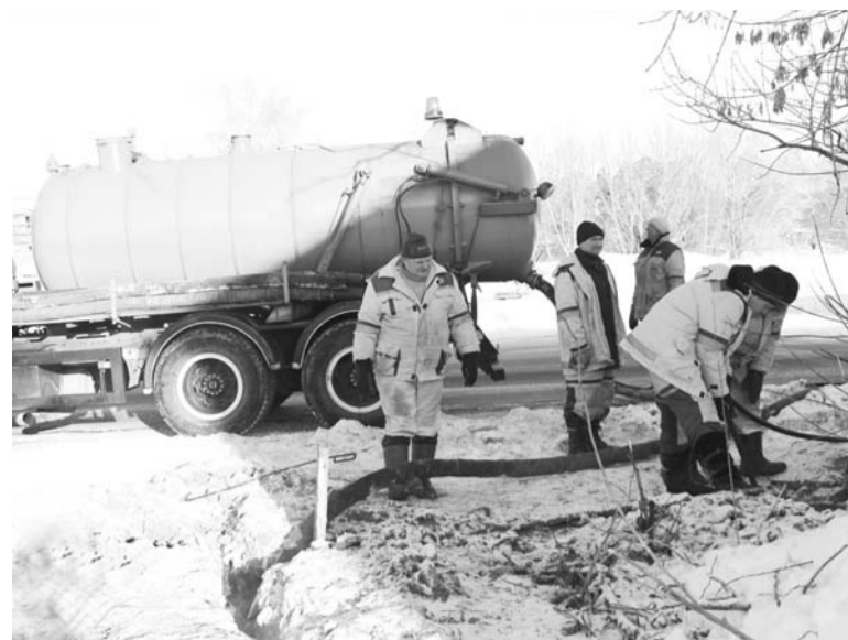
На улицах города - «Владимирводоканал»

Принимаются меры и для ликвидации прорыва на ул. Дорофеичева. Экскаватор, к «услугам» которого обычно прибегают городские комму-