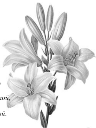
Мама, папа и бабушки

С днем рождения поздравляем! И от всей души желаем: В деле - полного успеха, В жизни - радости и смеха. Никогда не огорчаться, Не грустить, не волноваться, И, вступая в год свой новый, Быть счастливой и здоровой! Будь самой веселой и самой счастливой, Хорошей, и нежной, и самой красивой. Будь самой внимательной, самой любимой, Простой, обаятельной, неповторимой, И доброй, и строгой, и слабой, и сильной. Пусть беды уходят с дороги в бессилье. Пусть сбудется все, что ты хочешь сама. Любви тебе, веры, надежды, добра!