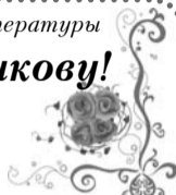
Коллектив Новкинской школы

Вас с юбилеем поздравляем! И не смотрите на года, От всей души мы Вам желаем - Такой счастливой быть всегда!