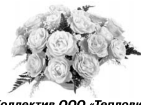
Коллектив ООО «Тепловик»

Кипит работа повседневно, Но вот среди обычных дней Вдруг наступает День Рождения, Чудесный праздник - юбилей! Хотим Вам пожелать удачи, Успеха в жизни, ярких дел, Чтоб Вы с улыбкой - не иначе - Встречали каждый новый день!