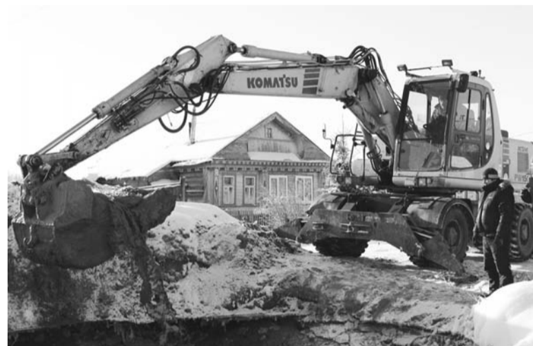
Одна из самых крупных аварий - на ул. Долбилкина

щей неделе достигли своего пика, стали, конечно, серьезным препятствием при выполнении работ. Да и сил у городских коммунальщиков явно недостаточно. Но помощь и техникой, и людьми сейчас оказывается, и довольно ощутимая. Поэтому давайте надеяться, что пусть не сразу, а шаг за шагом, поэтапно город справится со своими болевыми точками.