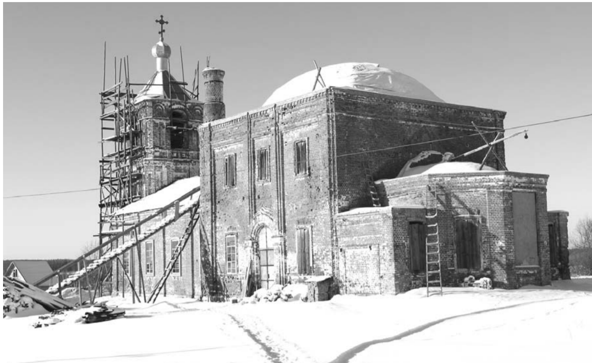
Терпите, реставраторы, скоро лето... (храм Ильи Пророка в Тынцах)

Понятно, что с первых лет советской власти церковь в Тынцах пытались закрыть. Но прихожане все же пытались храм сохранить и не могли превратиться в одночасье в атеистов. Верховная власть иногда шла на уступки. Так, 25 июня 1934 г. ВЦИК присылает директиву в Ковровский райисполком в связи с жалобой из с. Тынцы «на отказ в разрешении религиозных церемоний в праздники, хотя эпидемических заболеваний нет»: «Комиссия предлагает Вам с получением сего вопрос урегулировать и устранить препятствия, коль скоро нет на месте массовых заразных заболеваний». В конечном итоге церкви были все же закрыты, частью разорены, частью пе-