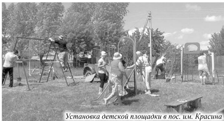
Установка детской площадки в пос. им. Красина