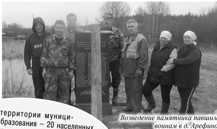
Возведение памятника павшим воинам в д. Арефино