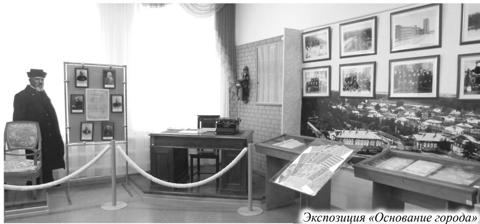
Экспозиция «Основание города»