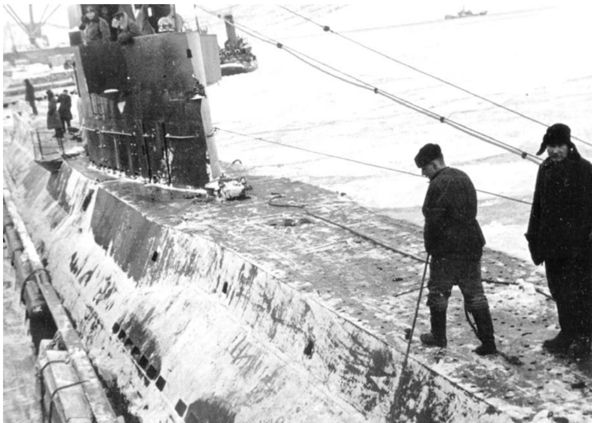
«Красногвардеец» («Д-3») в Полярном (фотография сделана зимой 1941-1942 г.г.)