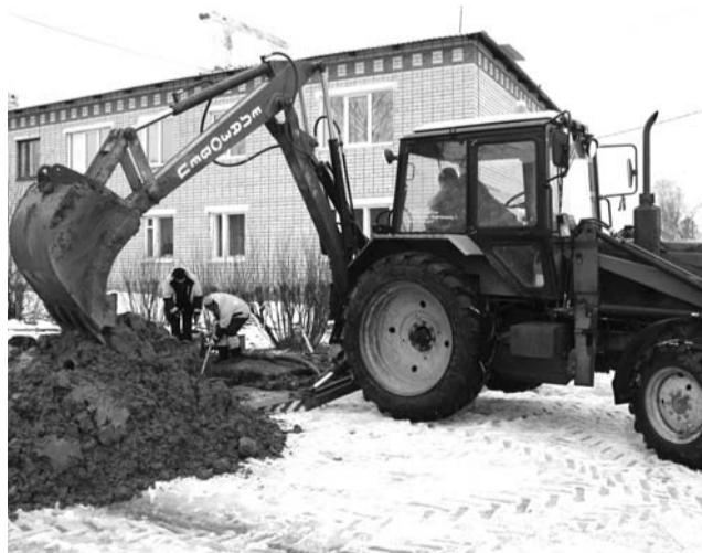
Рвануло на ул. Герцена