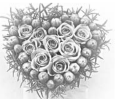
Дети, внуки, правнуки

с 60-летием совместной жизни – бриллиантовой свадьбой! Желаем мы вам от души В сердцах взаимной доброты! Не приносить друг другу бед И жить совместно до 100 лет!