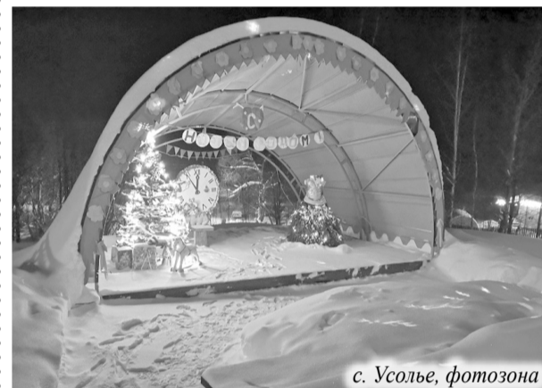
с. Усолье, фотозона

Внимание! Заявки принимаются ежедневно не позднее 19 декабря в управлении делами администрации Камешковского района по адресу: ул. Свердлова, д. 10, каб. 58, с 8:00 до 12:00 и с 13:00 до 17:00 в рабочие дни. Справки по телефону 2-23-75. С положениями о конкурсе можно ознакомиться на официальном сайте администрации Камешковского района на главной странице в разделе «Новости».