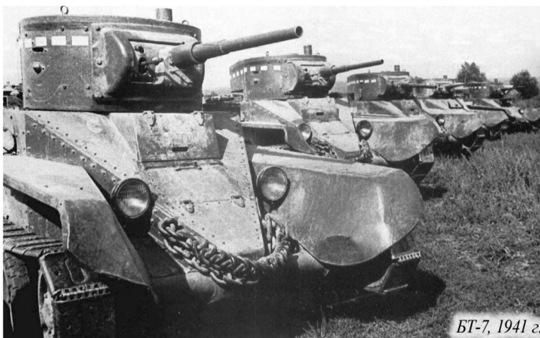
БТ-7, 1941 г.

Обеспечение прикрытия сосредоточения возлагалось на 42-й кав-