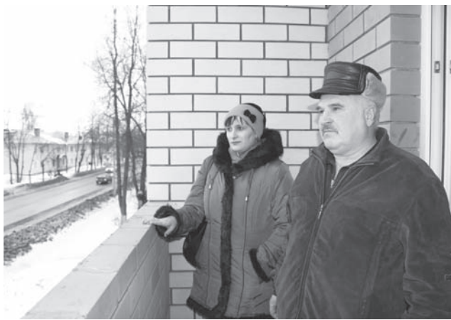
Новоселам Деминым вид с новой лоджии нравится

В прошлый четверг в городской администрации собрались все, кто в скором времени отметит новоселье в новостройке.