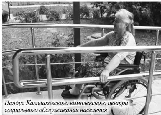
Пандус Камешковского комплексного центра социального обслуживания населения