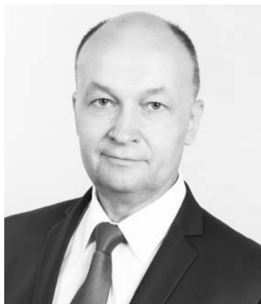
60% для граждан и 100% для предпринимателей - слишком высоки.