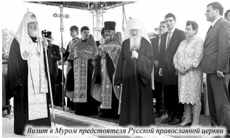
Визит в Муром предстоятеля Русской православной церкви