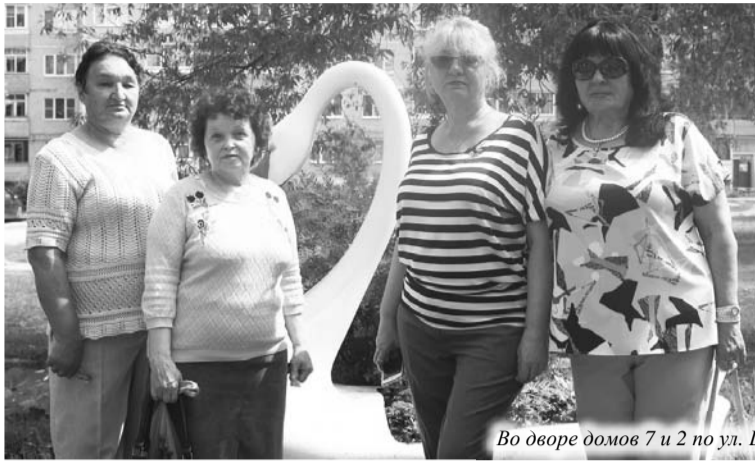
Во дворе домов 7 и 2 по ул. Школьной и Молодежной