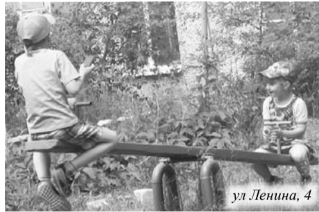
ул. Ленина, 4